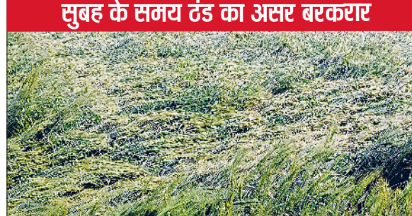
रेवाड़ी। एक खेत में तैयार हो रही गेहूँ की फसल।

तेज धूप निकलने के बाद दोपहर तक मौसम गर्म हो गया। अधिकतम तापमान 0.7 डिग्री की गिरावट के साथ 30.5 डिग्री सेल्सियस पर आ गया। रात का तापमान भी 0.8 डिग्री की कमी के साथ 9.0 डिग्री सेल्सियस दर्ज किया गया। हवा में नमी का स्तर कम होकर 38 प्रतिशत पर आ गया, जबकि हवाओं की रफ्तार 10 किलोमीटर प्रति घंटा रही। सुबह की ठंड का असर दोपहर तक गर्मी में बदल गया। दोपहर के समय पंखे चलने शुरू हो गए। दिन के समय गर्म कपड़ों की आवश्यकता भी अब नहीं रही है। मौसम विभाग के