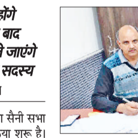
नारनौल। चुनाव कार्यालय में चुनावी प्रक्रिया करते चुनावी टीम।