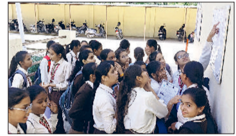
रेवाड़ी। हिंदू स्कूल में लिस्ट पर अपना कमरा नंबर देखते हुए छात्राएं, गवर्नमेंट बायज स्कूल के परीक्षा केंद्र का निरीक्षण करते डीसी व एसपी।

जिले में बुधवार से हरियाणा विद्यालय शिक्षा बोर्ड की वार्षिक परीक्षाएं शुरू हो गई हैं। पहले दिन बारहवीं कक्षा के विद्यार्थियों ने अंग्रेजी की परीक्षा दी। जिले में 54 परीक्षा केंद्रों पर हुई परीक्षा में 8 हजार से अधिक विद्यार्थी शामिल हुए। दोपहर साढ़े 12 बजे से शुरू हुई परीक्षा के लिए एक घंटा पहले से ही विद्यार्थी पहुंचना आरंभ हो गए थे, लेकिन कुछ परीक्षा केंद्रों पर विद्यार्थियों को आधा घंटा पहले एंट्री दी गई। फ्लाईंग स्कर्वॉयड की टीमों ने परीक्षा केंद्रों पर जांच की। सभी