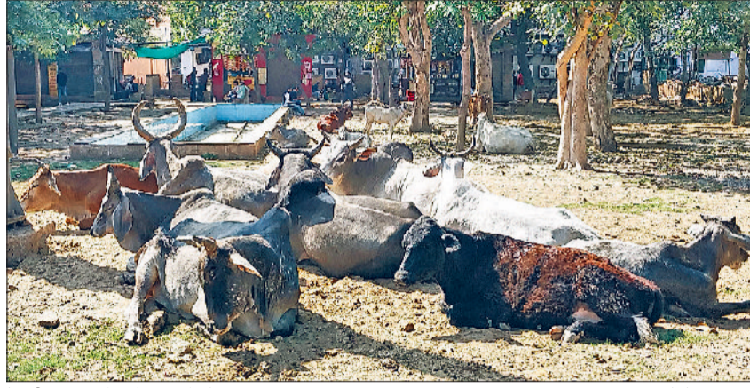
रेवाड़ी। ब्रास मार्केट के पार्क में गोवंश का जमावड़ा।

परिसर के सामने ब्रास मार्केट पार्क के पास कचरे का अंबार लगा हुआ है वहीं पार्क के अंदर पूरे दिन गोवंश का जमावड़ा लगा रहता है। सेक्टरों के पार्कों की दशा सुधारने की ओर भी ध्यान नहीं दिया जा रहा है। सेक्टरवासी दर्जनों बार प्रशासन को ज्ञापन देकर समस्या के समाधान की मांग कर चुके हैं। कई पार्कों की देखरेख नहीं होने के कारण घास भी गायब होकर जमीन दिखने लगी है। पार्कों में लगे झूले व लाखों रुपए की लागत से लगाई गई ओपन जिम मशीनों भी टूट चुकी है। ब्रास मार्केट के तिकोना की भी हालत दयनीय बनी हुई है।