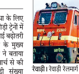
रेवाड़ी। रेवाड़ी रेलमार्ग से गुजरते हुए ट्रेन।