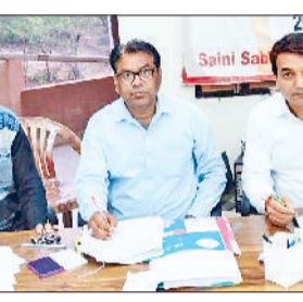
नारनौल। चुनाव कार्यालय में चुनावी प्रक्रिया करते चुनावी टीम।