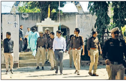
रेवाड़ी। हिंदू स्कूल में लिस्ट पर अपना कमरा नंबर देखते हुए छात्राएं, गवर्नमेंट बायज स्कूल के परीक्षा केंद्र का निरीक्षण करते डीसी व एसपी।